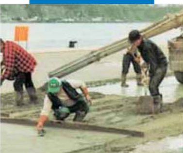
Цементная стяжка снаружи помещений с добавлением Planicrete