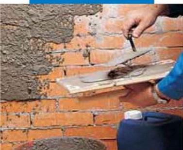
Связующий штукатурный слой с добавлением Planicrete