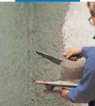
Нанесение цементных составов с добавлением Planicrete

Разведите Planicrete водой в подходящей емкости в соотношении, рекомендуемом для данного применения, налейте раствор в бетономешалку и добавьте цемент и заполнитель (предпочтительно уже перемешанные или частично смешанные, чтобы избежать комков, которые трудно размешать). Перемешивайте смесь до тех пор, пока она не станет однородной и равномерной, но не более 2-3 мин.