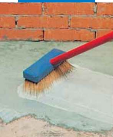
Нанесение адгезионного цементного раствора с добавлением Planicrete