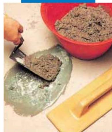
Ремонт пола: нанесение строительного раствора