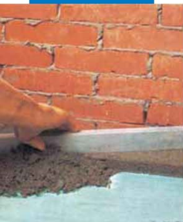
Укладка цементной стяжки с добавлением Planicrete