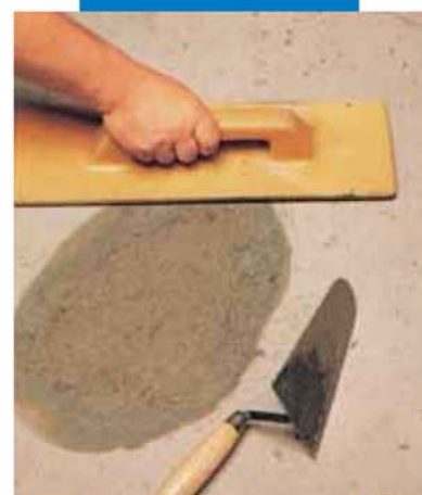
Затирание поверхности тёркой