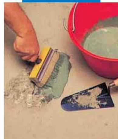
Ремонт пола с нанесением адгезионного слоя